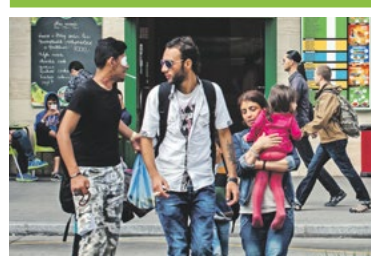
Határozott fellépés a migránsügyben