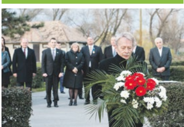
Megemlékezés magyar és lengyel hősekről