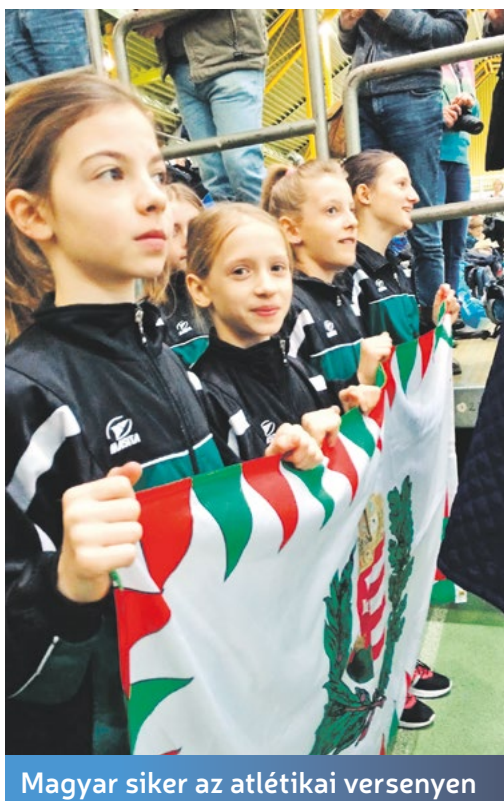
Magyar siker az atlétikai versenyen