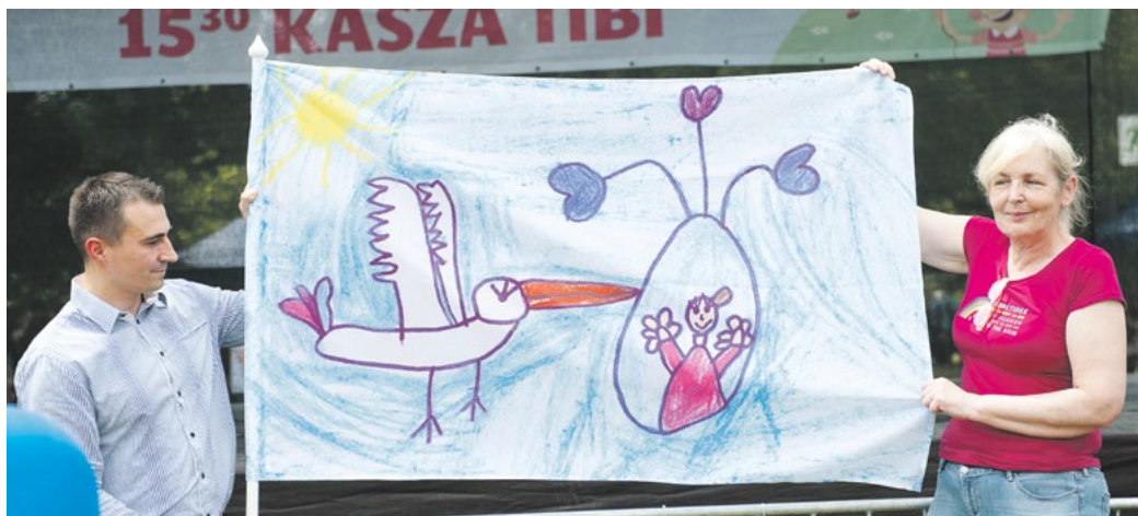
Csató Virág rajza szerepel az újszülöttek érkezését hírül adó babázászlón