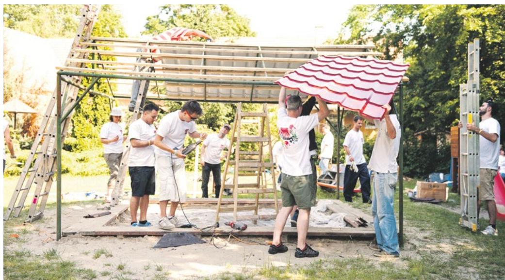
Az óvoda udvarát és két szobáját karitatív program keretében korszerűsítették