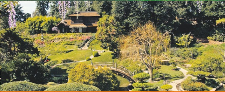
Látványtervek: a Rákóczi Kert pihenőparkká válik