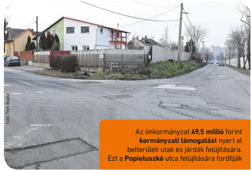
for: Tóth Beáta

Az ötéves fejlesztés során önkormányzati forrásból a földutakat szilárd útburkolattal látják el. Ezzel együtt 130 ezer négyzetméteren a közterületi csapadékvíz-elvezetést is megoldják. A beruházás keretében több mint 12 kilométer út épül, kétoldali járdával kiegészítve. A program a földutak szilárd burkolattal való ellátásán túl figyelmet fordít a már aszfaltos, de rossz állapotú útszakaszok felújítására is. Ilyen például a Duna utca , a Zsák utca vagy például a Vágóhíd utca . Fontos tudni ugyanak-