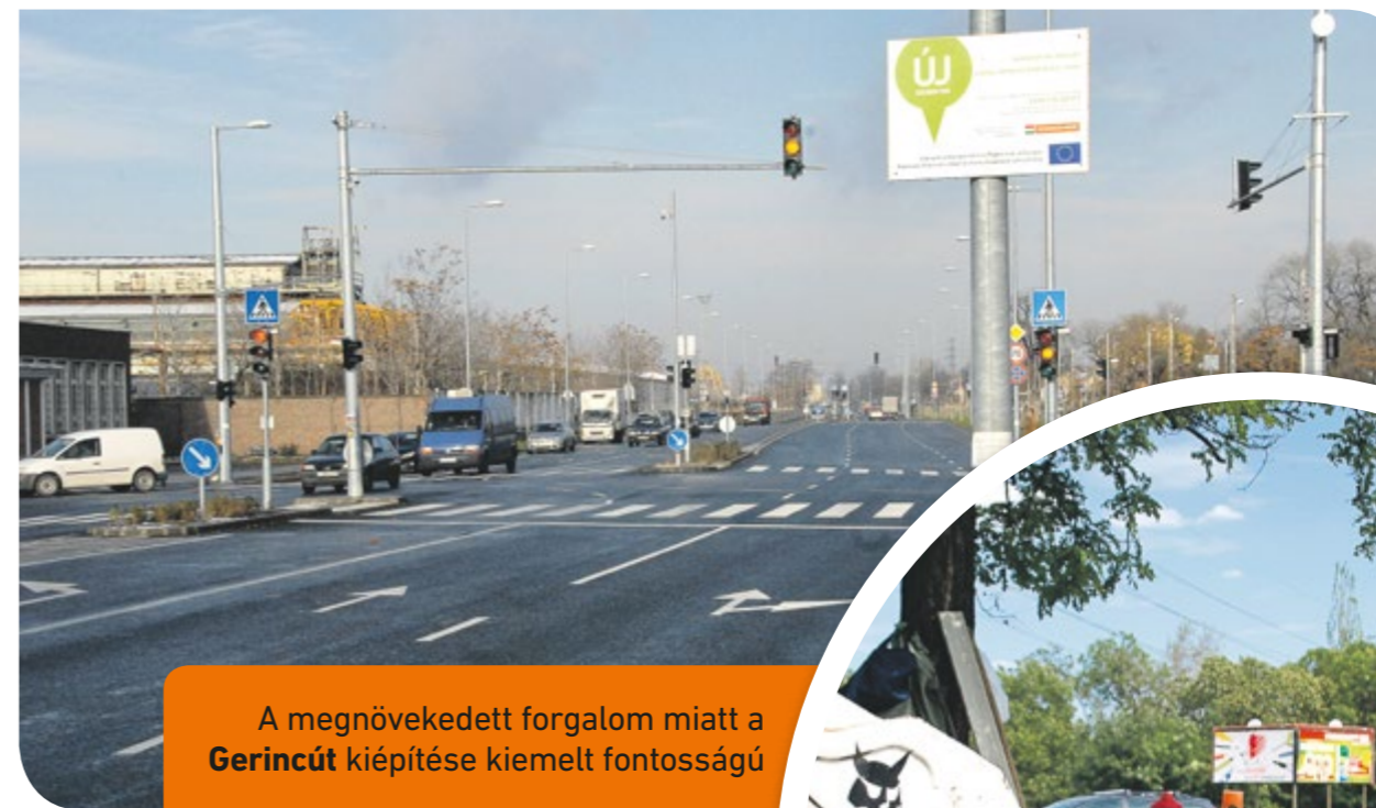
A megnövekedett forgalom miatt a Gerincút kiépítése kiemelt fontosságú

A Gerincút teljes kiépítése és a II. Rákóczi Ferenc út felújítása is fontos része a Weiss Manfréd Tervnek