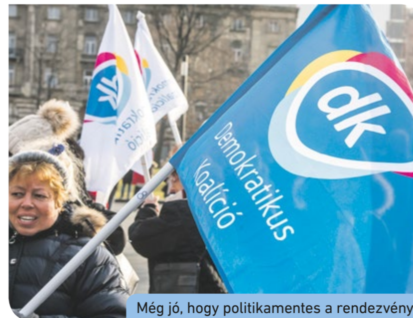
Még jó, hogy politikamentes a rendezvény