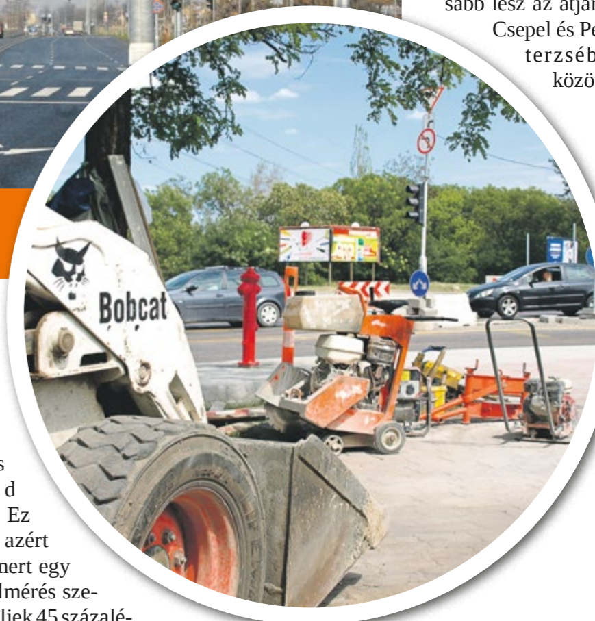
A Gubacsi híd teljes felújítása és kétsávossá tétele is prioritásként szerepel

ka az öt legfontosabb fejlesztés egyikeként jelölte meg a hídfelújítást. Ha a projektet elfogadják, a környező utak felújításával együtt csúcsidőben is jelentősen gyorsabb lesz az átjárás Csepel és Pestterzsébet között.