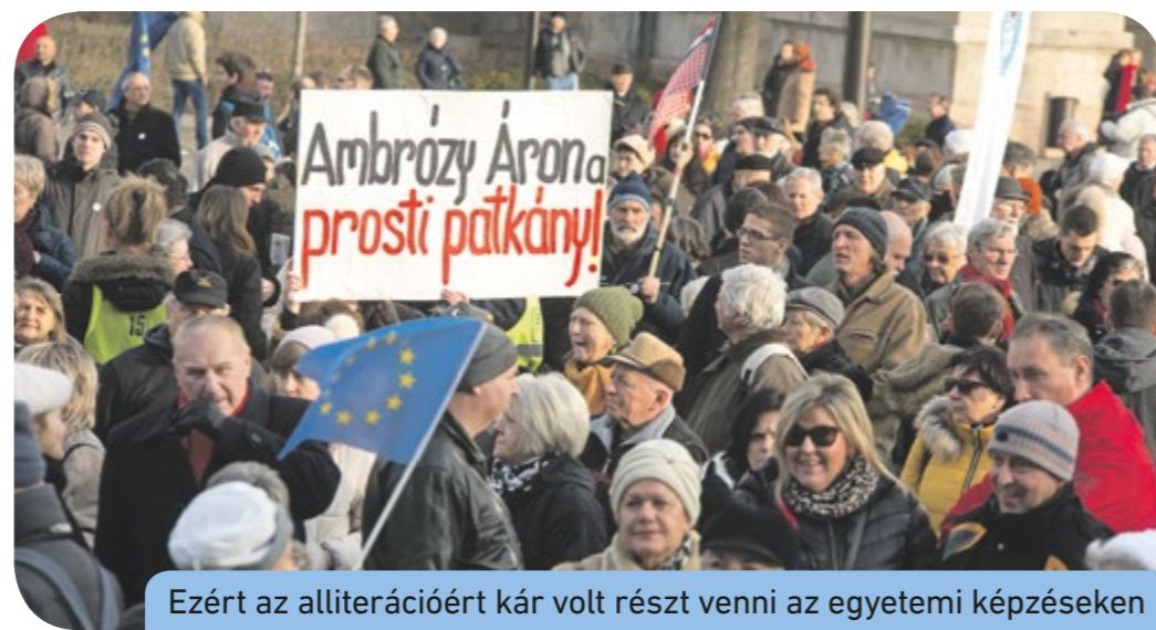
Ezért az alliterációért kár volt részt venni az egyetemi képzéseken

felhasználva a pedagógusokat és a gyerekeket egyaránt a Tanítanék mozgalmárjai és az ellenzéki pártaktívák – az MSZP, az LMP, a DK,