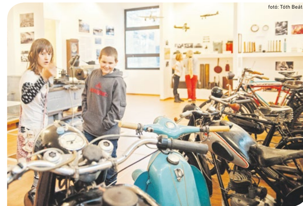
fotó: Tóth Beáta

Azt is elmondta, hogy a lakosság részéről rendszeresen érkeznek felajánlások, de a Csepeli Helytörténeti Gyűjtemény muzeális dokumentumainak, tárgyainak számát vásárlással is bővítik. A bemutatott három járművel az elmúlt