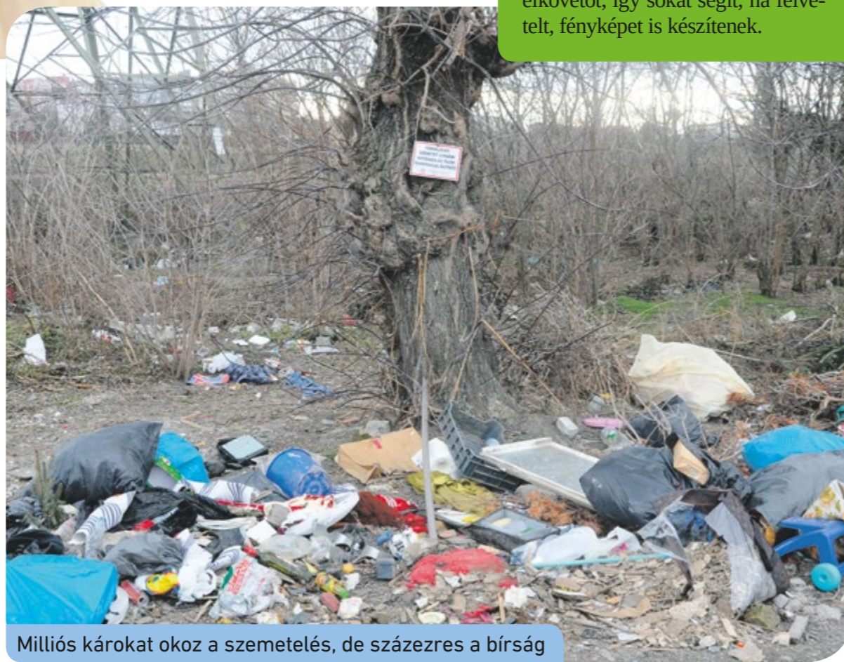
Milliók károkat okoz a szemétkerakás, de százazres a bírság

A csepeli önkormányzat nettó száz-ezer forintot ajánlott fel azoknak a nyomravezetőknél, akik érdelemes bejelentést tesznek a szemétkerakással kapcsolatban. A rendőrség is kéri a lakosságtól az értesítést, ha engedély nélküli hulladéklerakást tapasztalnak. Előfordult, hogy egy videofelvétel alapján fogtak el egy elkövetőt, így sokat segít, ha felvett, fényképet is készítenek.