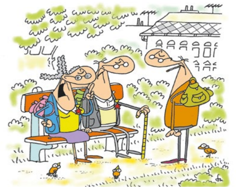
A LEGSZÍVESEBBEN KIVÁNDOROLNÉK INNEN BERLINBE. HA ITTHON NEM ÉREZNÉM MAGAM NAGYOBB BIZTONSÁGBAN!