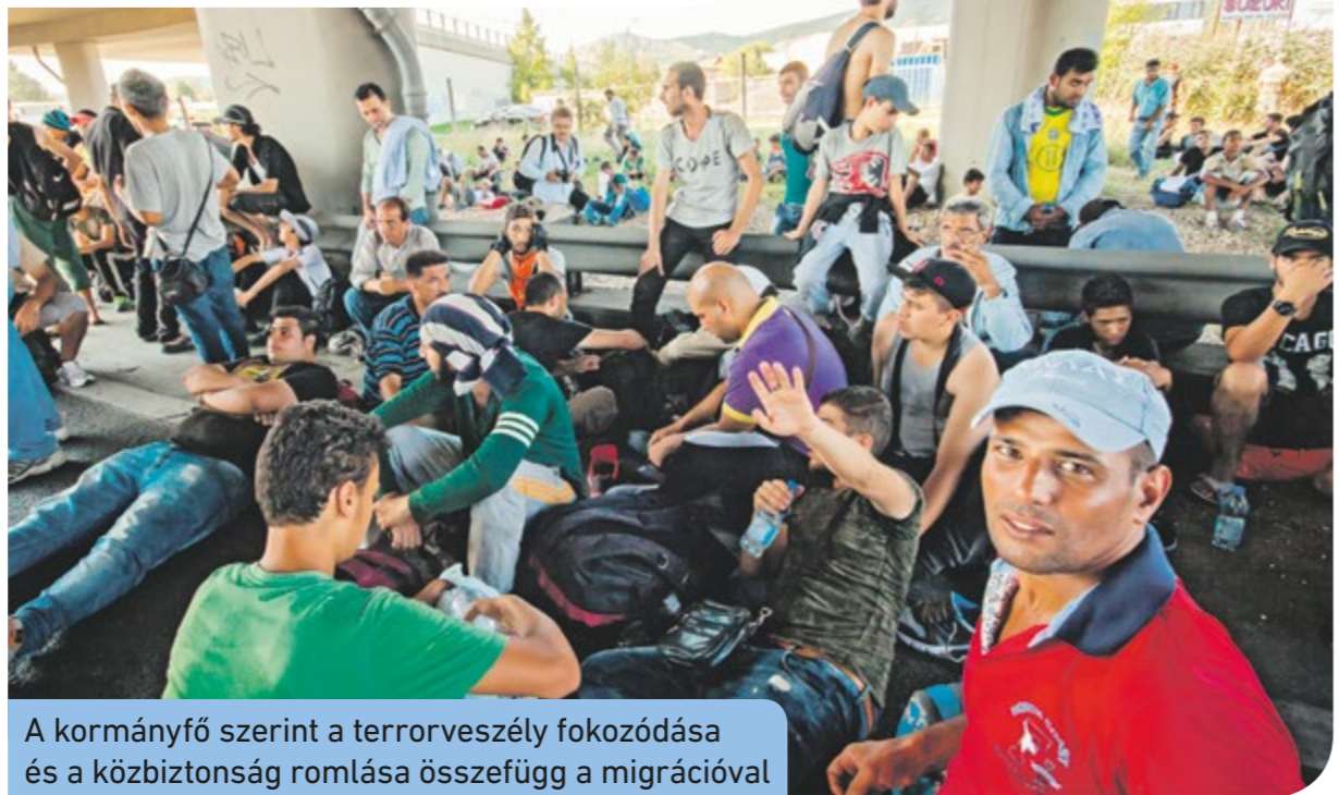
A kormányfő szerint a terrorveszély fokozódása és a közbiztonság romlása összefügg a migrációval

hogy a választási kampányban megbuktassák a kormányt. A miniszterelnök kifejtette: a brüsszeli bürokraták júniusban akarnak döntést hozni az új bevándorlási rendszerről, a bolgár