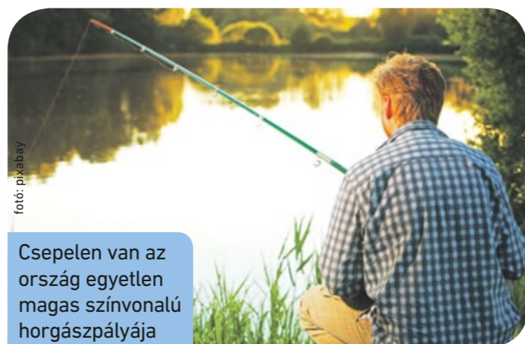
Csepelen van az ország egyetlen magas színvonalú horgászpályája

A Weiss Manfréd Terv része a környék eredeti állapotának megvédése és fejlesztése