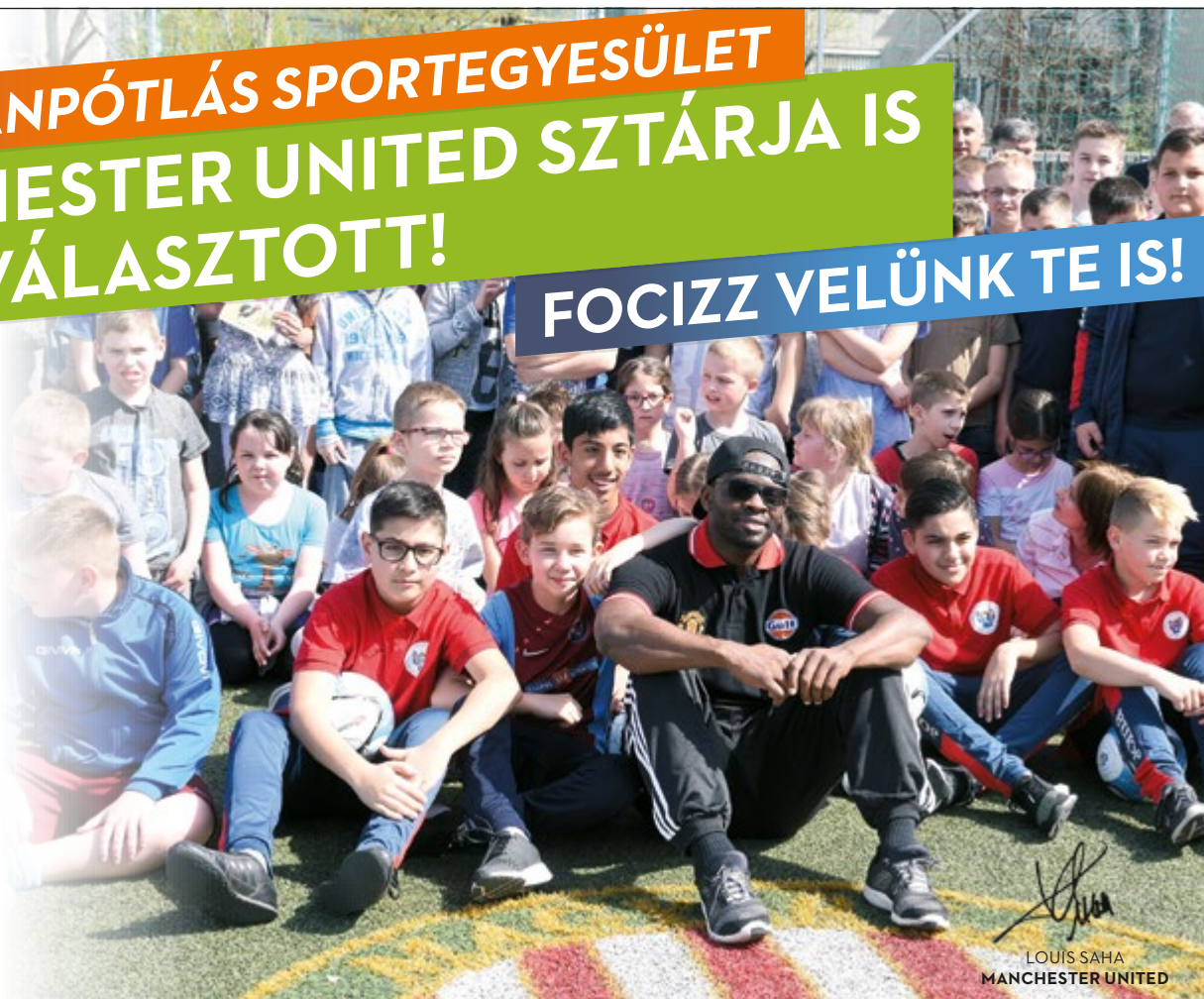
LOUIS SAHA MANCHESTER UNITED