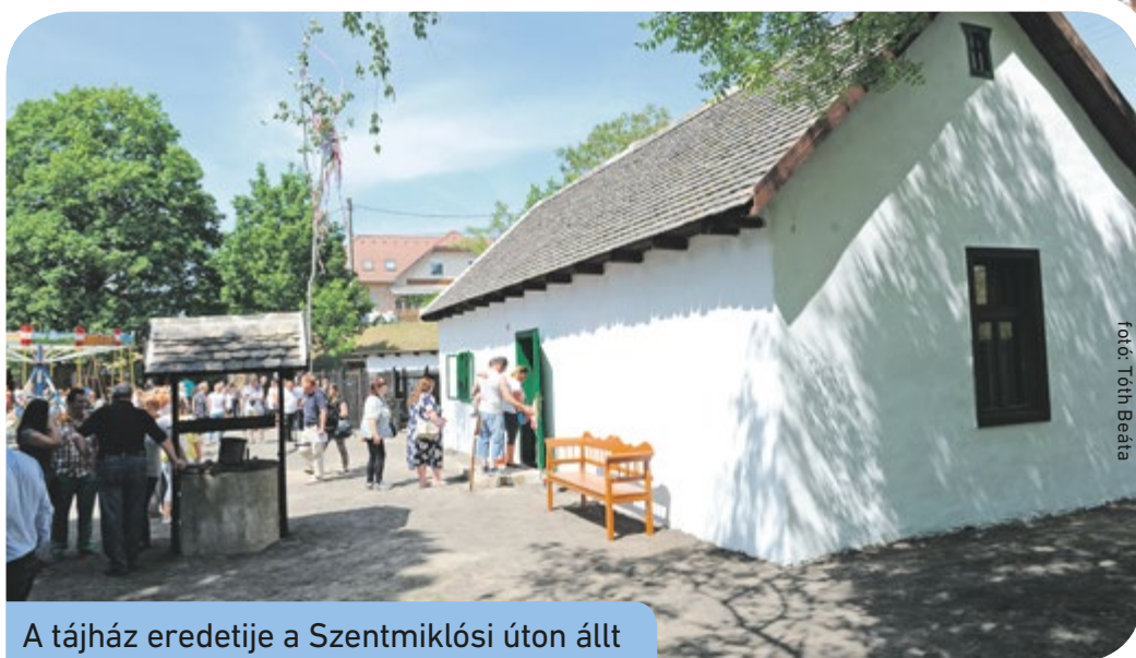
A tájház eredetije a Szentmiklósi úton állt