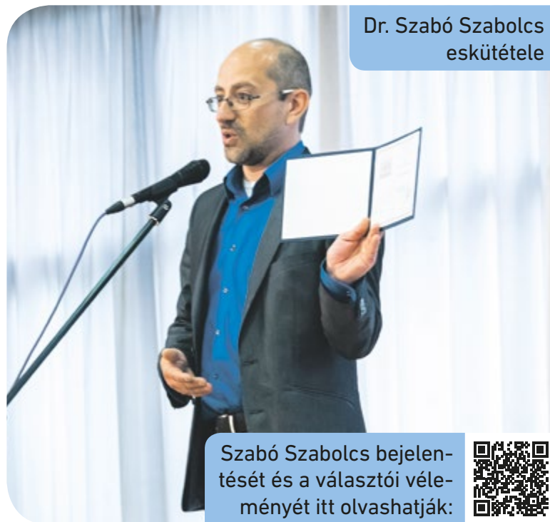
Dr. Szabó Szabolcs eskütétele

Ilyen előzmények után lépett át az Együtt politikusa az LMP-frakcióba az első adandó alkalommal. „Az volt az egyszerűbb döntés, hogy képviselőcsoporthoz kell csatlakoznom annak érdekében, hogy még eredményesebben képviseljem szavazóimat, és rendszerváltó alternatívát” – írta döntéséről, amit azzal magyarázott, hogy az LMP áll hozzá a legközelebb.