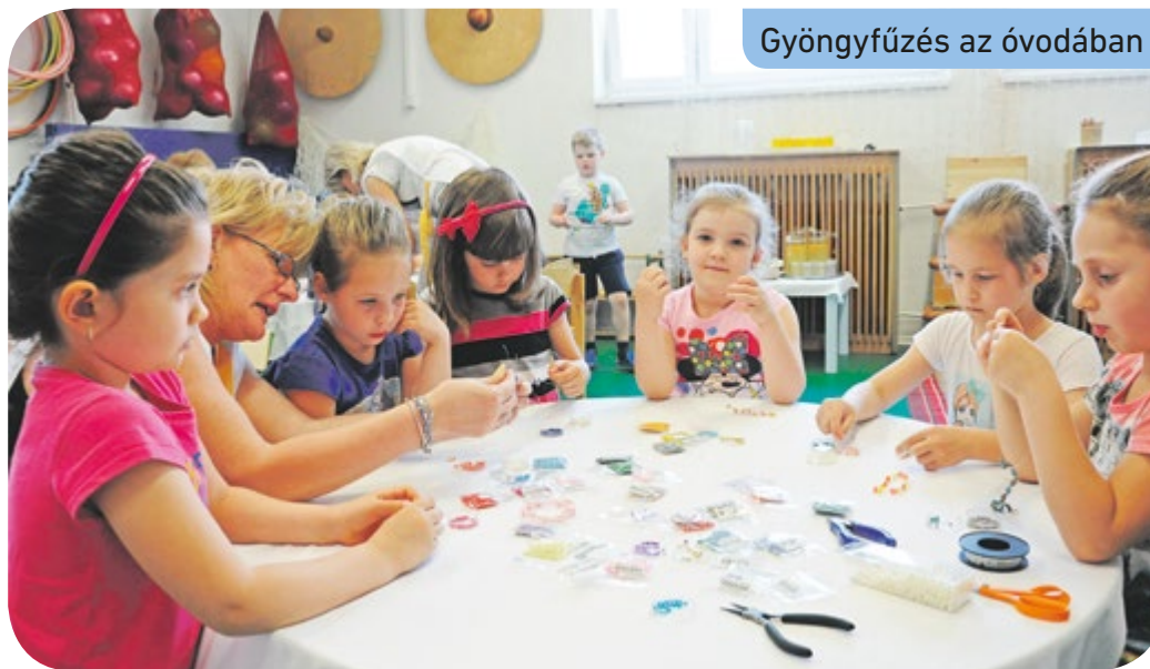
Gyöngyfűzés az óvodában

A program kéthetes projektekben, heti egyszer 45 perces foglalkozásokkal valósul meg, hetenként váltva a népi gyermekjátékok, néptánc és a kézműves-foglalkozások között.