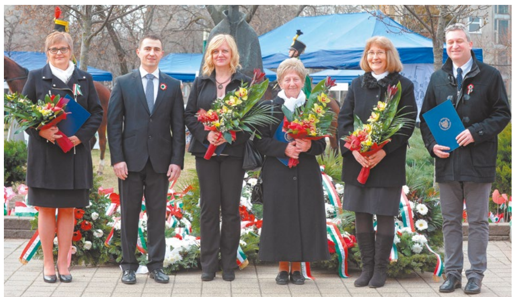
A Csepel Szolgálatáért Díj idei kitüntetettjei