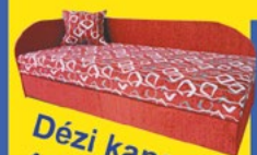
Dézi kanapé 49.900 Ft-tól