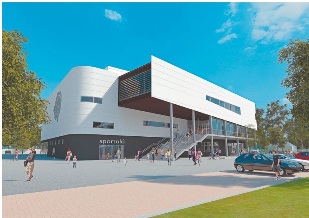
A csepeli birkózóakadémia látványterve

Németh Szilárd, a Magyar Birkózó Szövetség elnöke lapunknak azt nyilatkozta, kéri, hogy ezek után a feljelentők és az őket biztató, az akadémiáról valótlanúságot állító dr. Szabó Szabolcs és Kunhalmi Ágnes balliberális és Szilágyi György jobbkios politikusok, és az egész ügyről hamis híreket közlő Soros–Simicska-média kérjen bocsánatot az általuk megalázott magyar birkózócsaládtól és a félretájékoztató, becsapott csepeliektől.