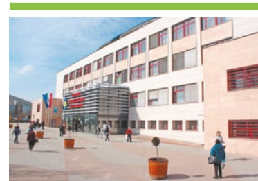
Mammográfia a szakrendelőben 6. OLDAL