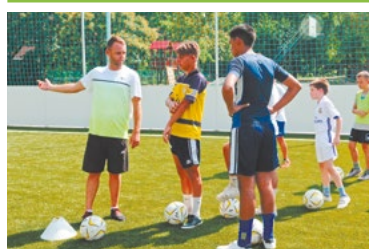
Új szakemberek az utánpótlásnál 5. OLDAL