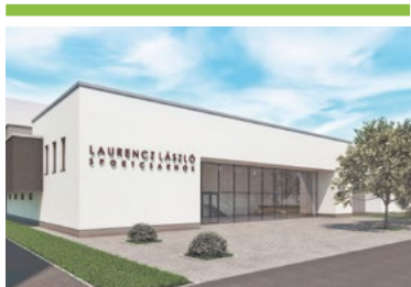
Kézilabdacsarnok épül Csepelen 2. OLDAL