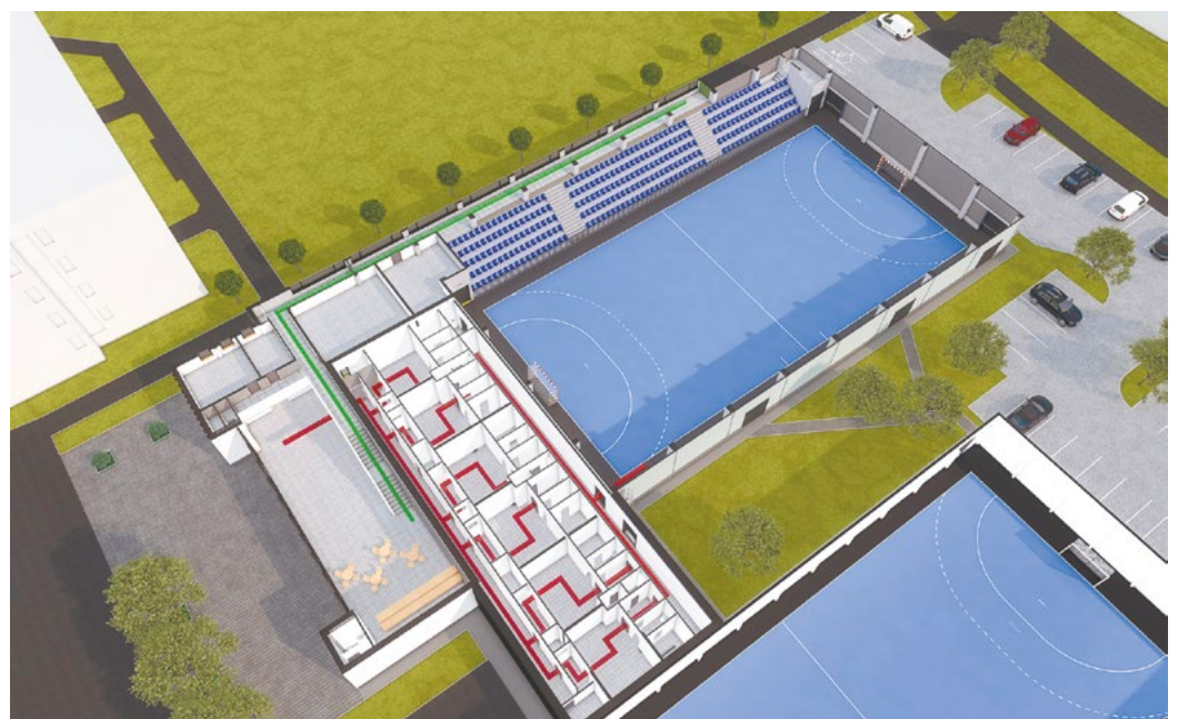
Az új sportcsarnok az ÁMK mellett épül fel