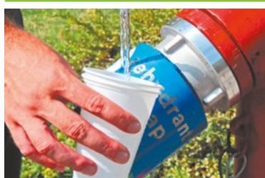
Ivócsapok már a kerületben is 3. OLDAL