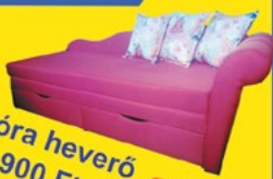
Flóra heverő 54.900 Ft-tól