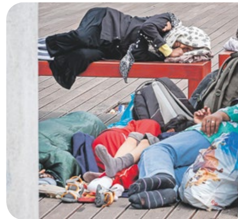
Képeink 2015 őszén készültek a Keleti pályaudvaron

Nyomós nemzetbiztonsági oka van annak, hogy Szél Bernadett LMP-s társelnököt Németh Szilárd, a testület kormánypárti alelnöke eltávolította a nemzetbiztonsági bizottság üléseitől: az ellenzéki politikus a migrációs válság közepén egy olyan külsős szakértő munkatársat jelölt a bizottságba, akinek az átvilágítása során problémák merültek fel: Kabulban született, illetve az egyik leginkább bevándorlópárti Soros-szervezet, a MigSzol alkalmazottja volt (ezt a tanácsadó cáfolta).