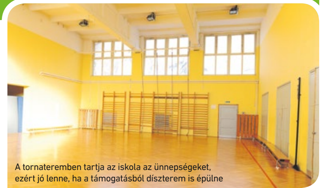
A tornateremben tartja az iskola az ünnepségeket, ezért jó lenne, ha a támogatásból díszterem is épülne

közreműködésére, akit felkértem, hogy delegáljon egy egyházi személyiséget, hiszen mégiscsak egy bencés alapítású gimnáziumról van szó. A kormányban, a tudományos-műszaki és a gazdasági világ felső köreiből mindenhol vannak jedlikesek. És ezt nem egy budai elitgimnázium érte el. Éppen ezért mi sem csak az „építési betont” látjuk, hanem azt szeretnénk, hogy feltámadjon, megerősödjön, megújuljon ez a dicső iskolai tradíció. A Jedlik Ányos Gimnázium Csepel szellemi, tudományos zászlóshajója lesz.