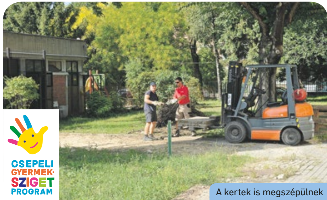
A kertek is megszépülnek

ban is hasonló újításokkal készülnek a kivitelezők, fapadokkal, ivókutakkal gazdagítják az óvoda udvarát. A gyerekek védelmében új kerítést építettek, és ütészálló burkolattal óvják a kicsiket. A Napsugár Óvodában az előbbieket is, melyeket autista gyerekek közösen használhatnak egészséges társaikkal. A Nagy Imre iskola udvarát is teljesen megújítják: a telepített cserjék és virágok Csepel színeit tükrözik vissza, a játszóházak és ugrólóvárok mellett kerékpártárolóval is gazdagítják az iskola udvarát. • AT