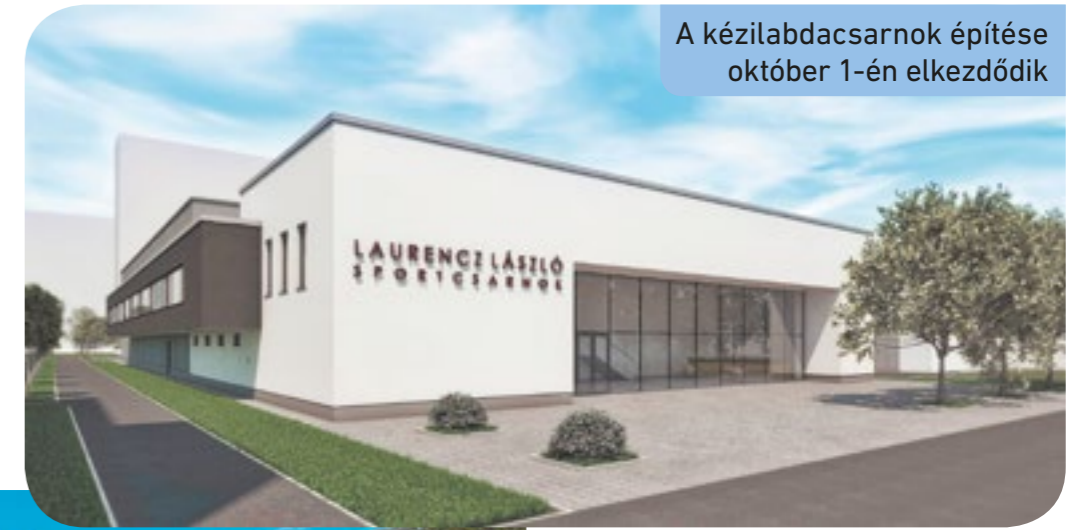
A kézilabdacsarnok építése október 1-én elkezdődik

A legemlékezetesebb számára az 1995-ös vb-döntő, amelyet a válogatott Bécsújhelyen játszott. „Annyian jöttek ki szurkolni Ausztriába, hogy nem lehetett közlekedni az autópályán” – idézi fel. A mai napig szembesül azzal, milyen sokat jelentett a magyaroknak a válogatott eredményes szereplése. „Ismeretlen emberek hálálkodnak, hogy milyen sok örömet szereztem nekik. Pedig a sikereket nem egyedül értem el, kellett hozzá a lányok is” – mondja.