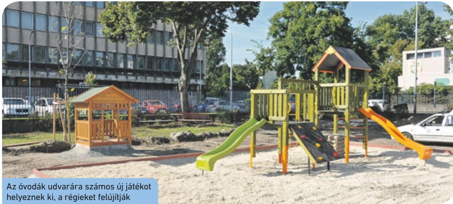
Az óvodák udvarára számos új játékot helyeznek ki, a régieket felújítják