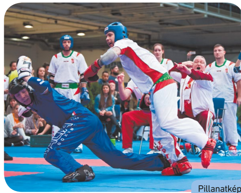
Pillanatképek a 2017-es budapesti vb-ről

Legfontosabb feladatának azt tekinti, hogy az európai és a világszövetségi székhelyeket Magyarországra hozza, emelve ezzel Budapest és Magyarország presztízsét. A kormány is nyitott erre, az ezzel kapcsolatos tárgyalások hamarosan elkezdődhetnek. Az év legrangosabb kick-box viadalát ismét hazánkban rendezik, ezzel kapcsolatban is vannak teendői. Augusztus 23-a és szeptember 1-je között Győr ad otthont az utánpótlás Európa-bajnokságnak. Ez az egyik legnagyobb létszámot megmozgató rendezvény a sportágban, a 8–18 éves korosztály több mint háromezer sportolója jön Győrbe. „Szerencsések vagyunk, mert nemcsak a kormány, hanem a főváros támogatását is élvezzük. Korábbi rendezvényeinken Schmitt Pál volt