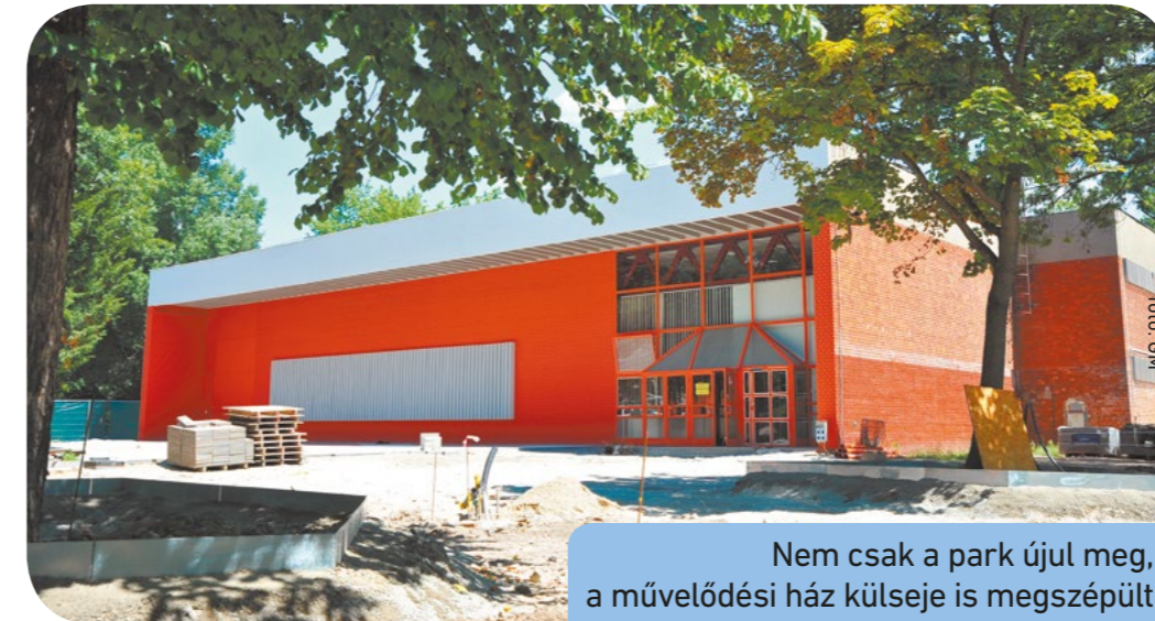
Nem csak a park újul meg, a művelődési ház külseje is megszépült

fák pótlása, valamint több ezer cserje és évelő növény ültetése a kivitelezés utolsó fázisában történik.