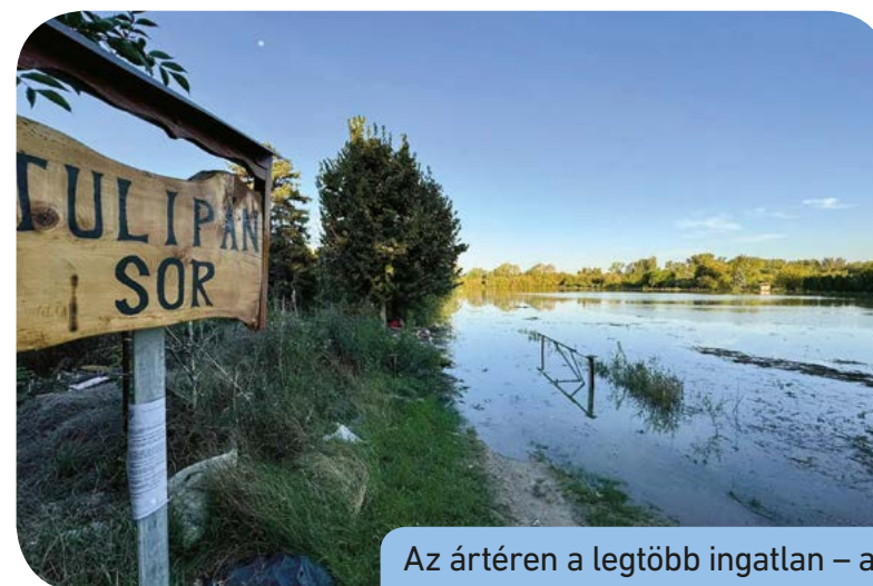
Az ártéren a legtöbb ingatlan – ahogy az várható volt – víz alá került