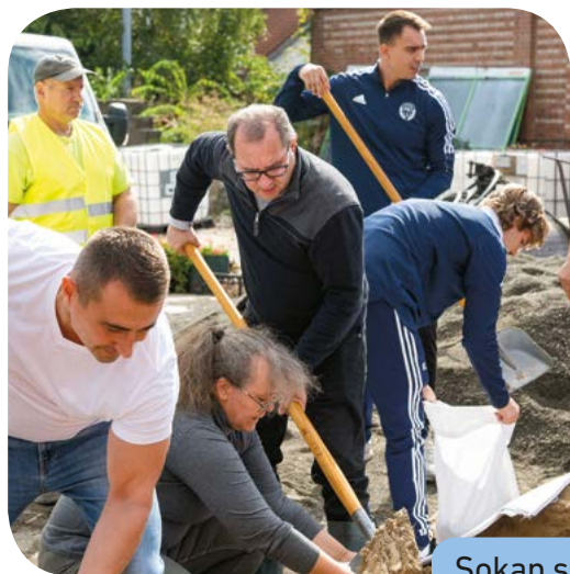
Sokan segítettek a védekezésben