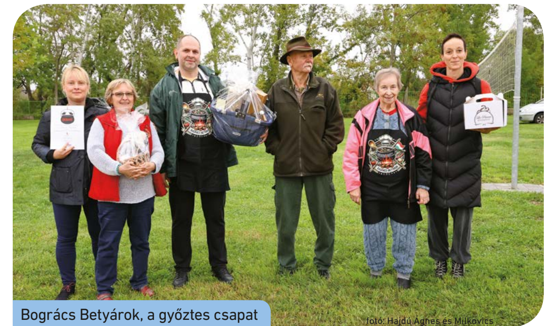
Bogrács Betyárok, a győztes csapat