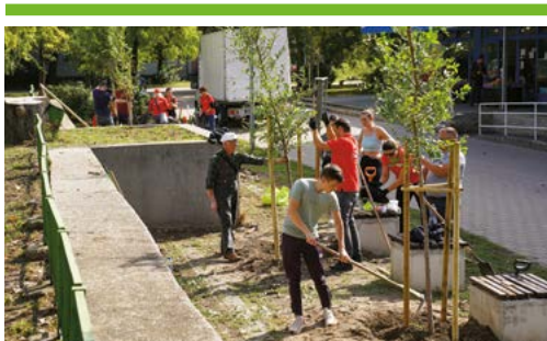
Ötven fát ültettek a Csete Balázs sétányánál