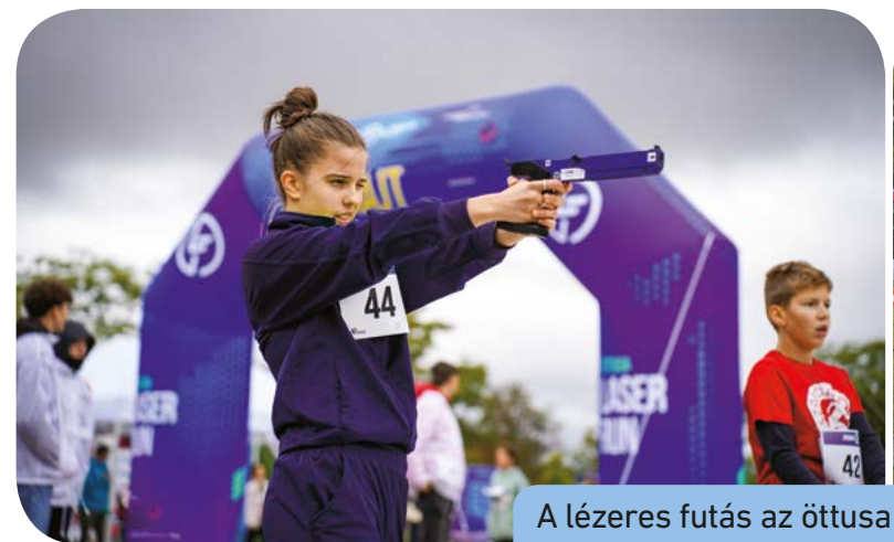
A lézeres futás az öttusa leglátványosabb száma