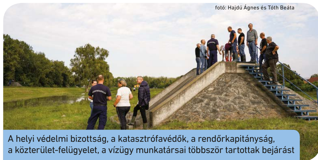
A helyi védelmi bizottság, a katasztrófavédők, a rendőrkapitányság, a közterület-felügyelet, a vízügy munkatársai többször tartottak bejárást