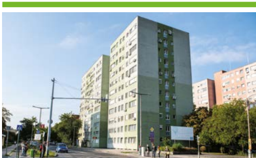
Csepeli Panelprogram: újabb támogatások