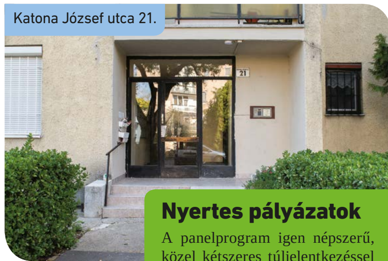
Katona József utca 21.