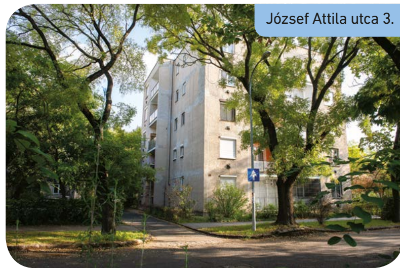
József Attila utca 3.