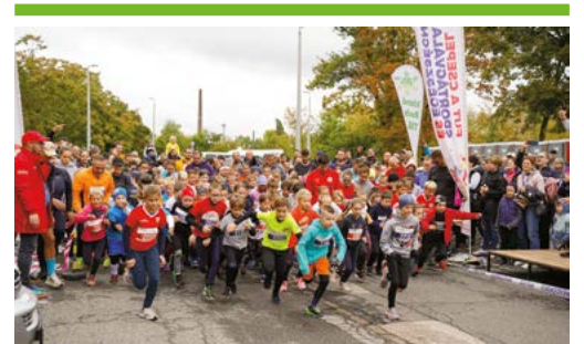
Fut a Csepel: idén kétezeren vettek részt