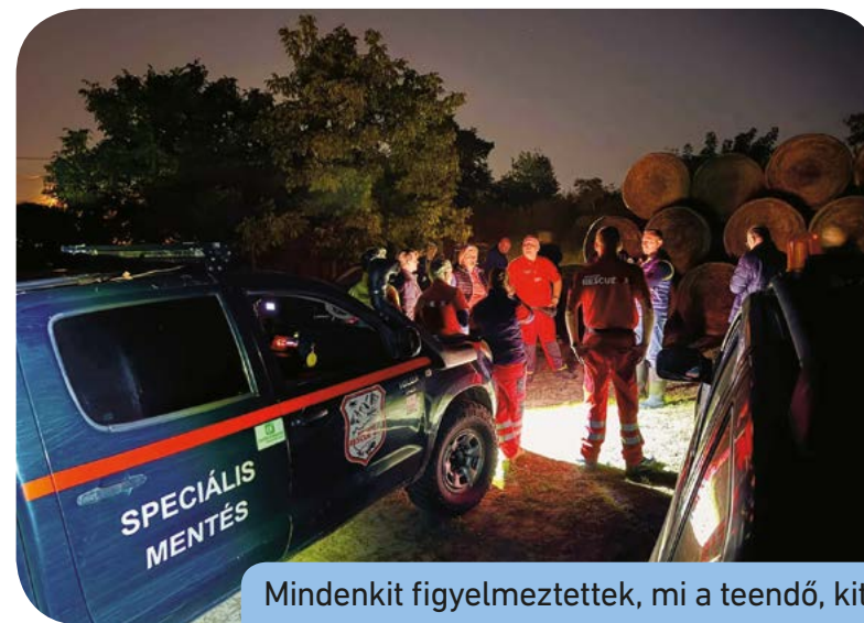
Mindenkit figyelmeztettek, mi a teendő, kitől kérhetnek segítséget, ha erre rászorulnak

Szeptember 17-e: A reggeli órákban a kerületi sportegyesületek és helyi civilek fogtak össze az árvíz elleni küzdelemben. Ott voltak a Halker-KirályTeam, a Csepeli Birkózó Club, a Csepel FC Utánpótlás Sportegyesület és a Csepeli Öttusa és Vízi Sport Egyesület sportolói és edzői, valamint a Közösen Csepelért Polgári Egyesület megválasztott képviselői és aktivistái. A Városgazda telephelyén több száz zsákot töltöttek meg homokkal, és szállították őket a megvédendő partszakaszokra. A Rév és a Nefelejcs utca környékén közben fokozottan járőröztek a rendőrök, a közterület-felügyelet munkatársai és mezőőrök. Mindenkit figyelmeztettek, mi a teendő, és kitől kérhetnek segítséget, ha erre rászorulnak. Délután a közterület-felügyelet munkatársai két drónnal pásztázták a Tinódi és a Klapka utca környékét, hogy valóban mindenki elhagyta-e a területet. Hőkamerát is bevetettek, amelyek