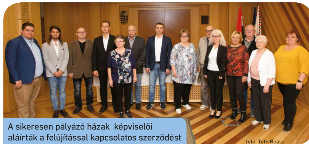
A sikeresen pályázó házak képviselői aláírták a felújítással kapcsolatos szerződést

A Csepeli Panelprogramon ideiglenes költségkerete elfogyott, de jövőre ismét lehet pályázni, hisz a program tovább folytatódik. Azok is indulhatnak ismét, akik már nyertek, de ezúttal új projektötlettel várják pályázókat – tette hozzá Borbély Lénárd . • Potondi Eszter